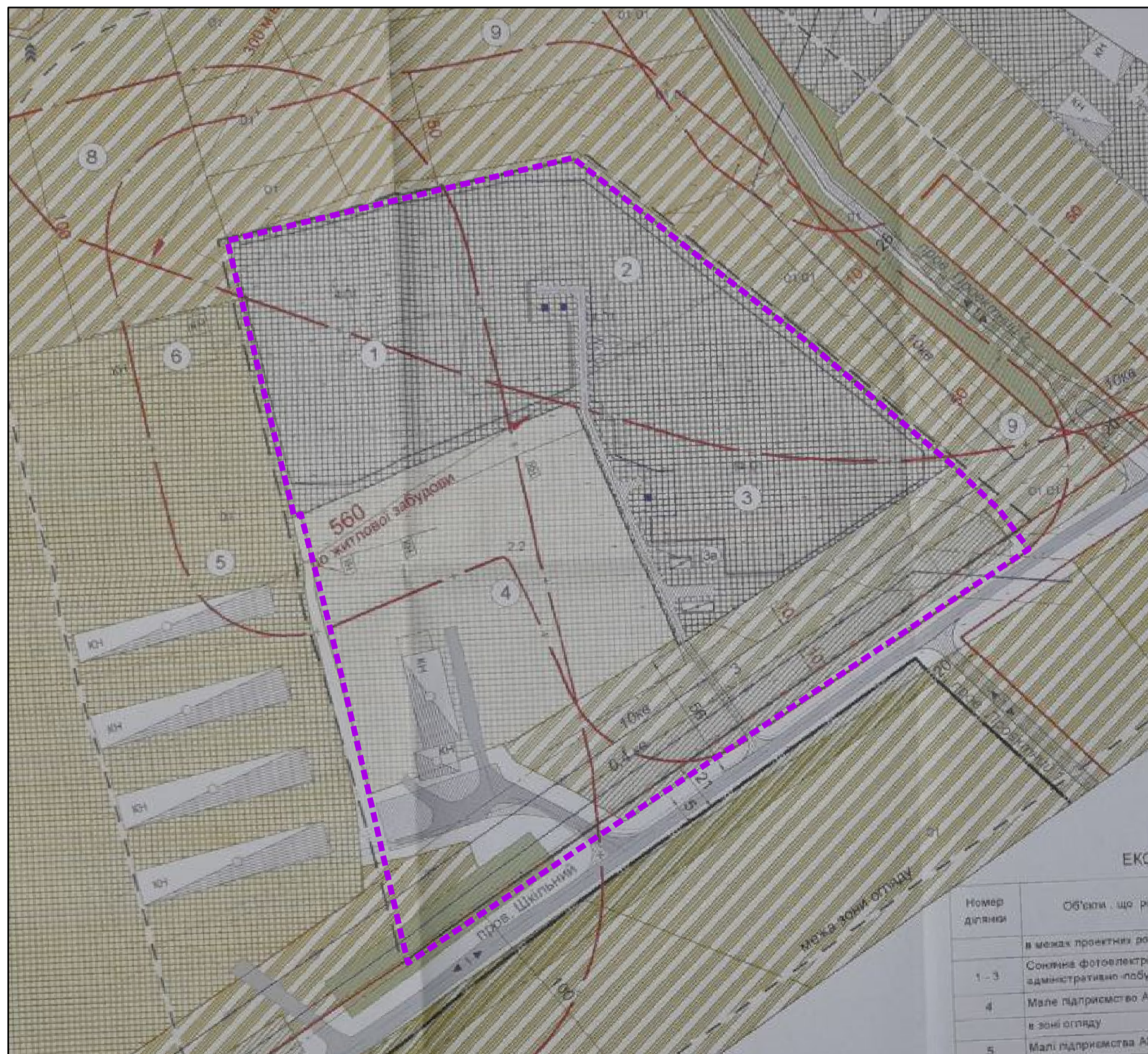
Фрагмент основного креслення детального плану частини території виробничої зони по вул. Сонячна - пров. Шкільний в с. Межирич Павлоградського району Дніпропетровської області